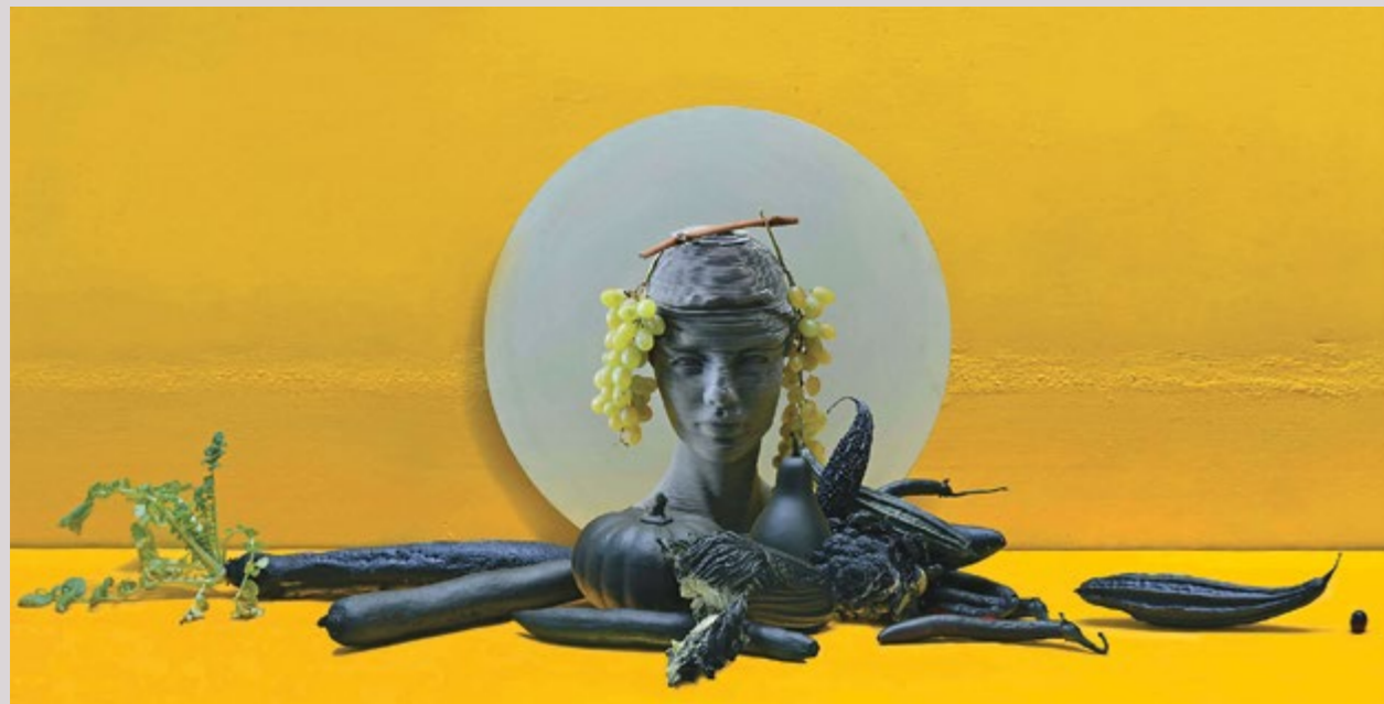
Maziar Mokhtari, Untitled from the Museum series , chromaluxe print, 50 x 100 cm, edition of 5 + 2 AP, 2021.

Som en drøm, der går i opfyldelse. Sådan beskriver O Gallerys grundlægger, Orkideh Daroodi, sit arbejde med galleriet og dets kunstnere. Siden 2014 har Daroodis formål med O Gallery været at hive unge kunstnere frem i lyset og sætte dem på både det lokale og internationale landkort. Senest kunne galleriets besøgende opleve udstillingen 'Blooming Lights' af billedkunstneren Shahrzad Jahan (f. 1995), der bor og arbejder i hovedstaden. I en serie af blågule pasteltegninger og oliemalerier undersøger hun, hvordan et materiale som krudt, der både anvendes til at fremstille våben og fyrværkeri, skifter betydning alt efter konteksten, det indgår i. Det er bestemt også som en drøm, der går i opfyldelse, at stifte bekendtskab med Jahans værker. >>