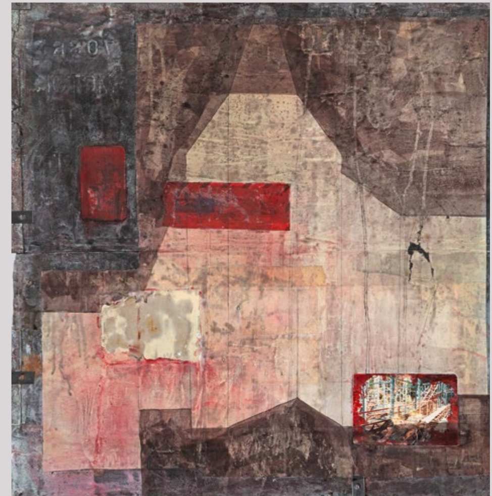
Majid Biglari, Farewell Party From Soot, Fog, Soil Series . Mixed Media on Tinplate, 61 x 63 cm (24 x 24.8 in). Unique Edition, 2021

side om side udgør værkerne af de tre kvinder et selvportræt af en generation, der blev undfanget i frygt og angst for krigen, og hvis liv er præget af tvang og uforløste drømme. Værkerne gør dybt indtryk og fortæller på hver deres måde en historie om den politiske virkelighed, kunstnerne befinder sig i. Desværre er galleriets tidligere udstillinger ikke lige så lette at udforske virtuelt, som hos de førnævnte, men kunstneres biografier og de enkelte værker er veldokumenterede på hjemmesiden. Igen vil vi anbefale at besøge galleriets sociale medier, enten på Facebook eller Instagram @mohsengallery, da det ofte er her, at seneste nyt om udstillinger og kunstnere bliver meldt ud først. ●