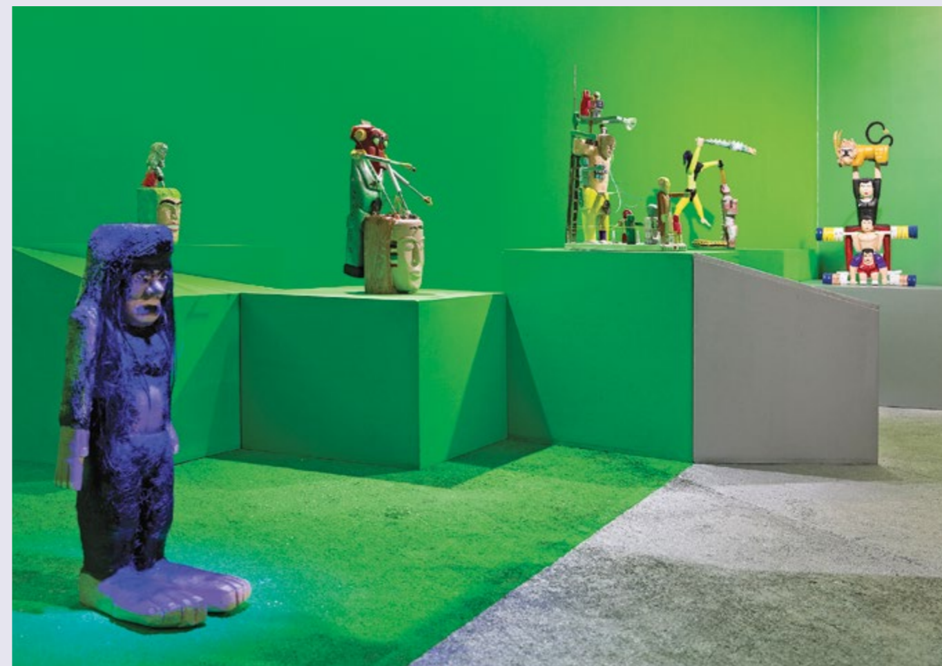
Amir Kamand. Aliens VS Gorillas. Dastan's Basement. Installation View.