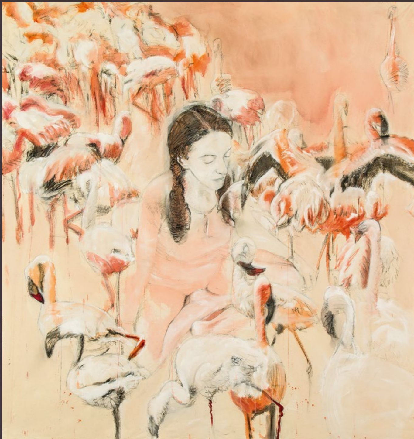
Pantea Rahmani, Becoming One , Mixed Media on Primed Canvas, 206 x 197 cm, 2016.

“Dette efterår kunne man blandt andet (red. på Etemad Gallery) se den retrospektive udstilling In Bewilderment of Birds .”