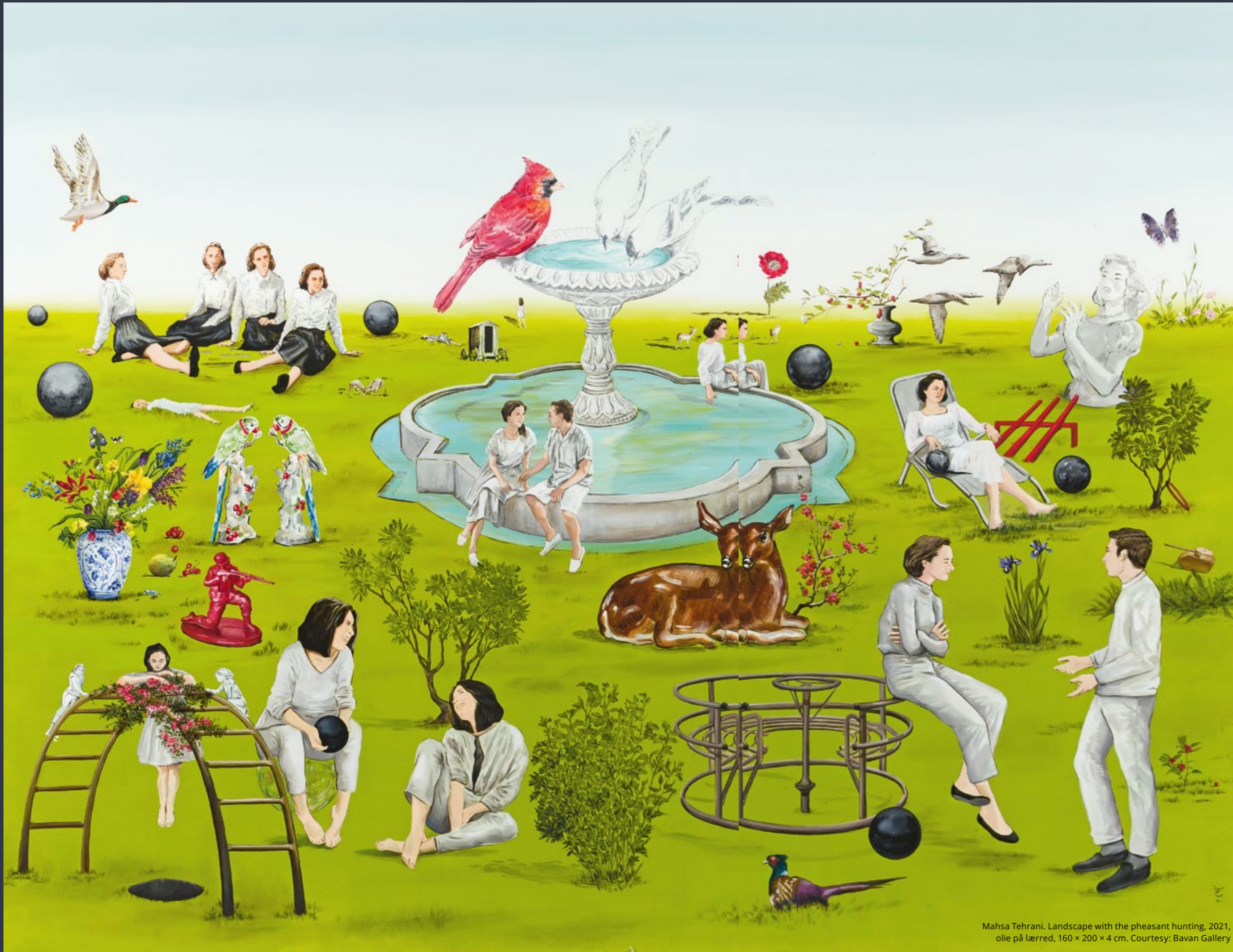
Mahsa Tehrani. Landscape with the pheasant hunting, 2021, olie på lærred, 160 × 200 × 4 cm.